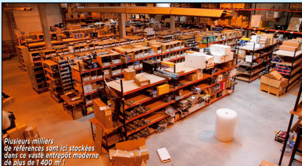
Plusieurs milliers de références sont ici stockées dans ce vaste entrepôt moderne de plus de 1 400 m 2 !