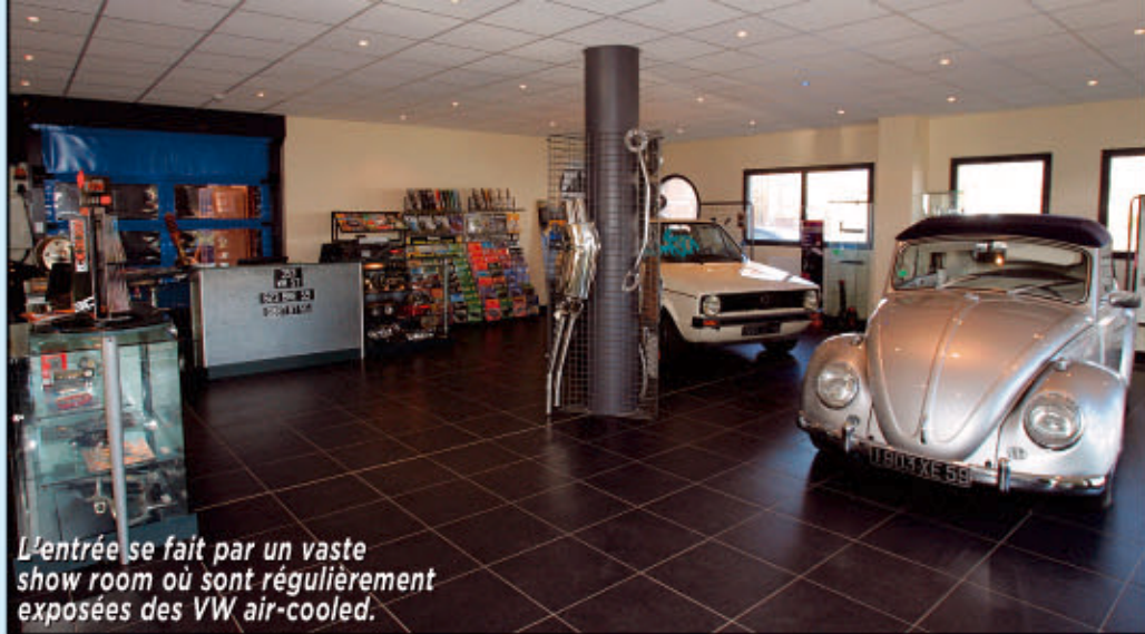
L'entrée se fait par un vaste show room où sont régulièrement exposées des VW air-cooled.