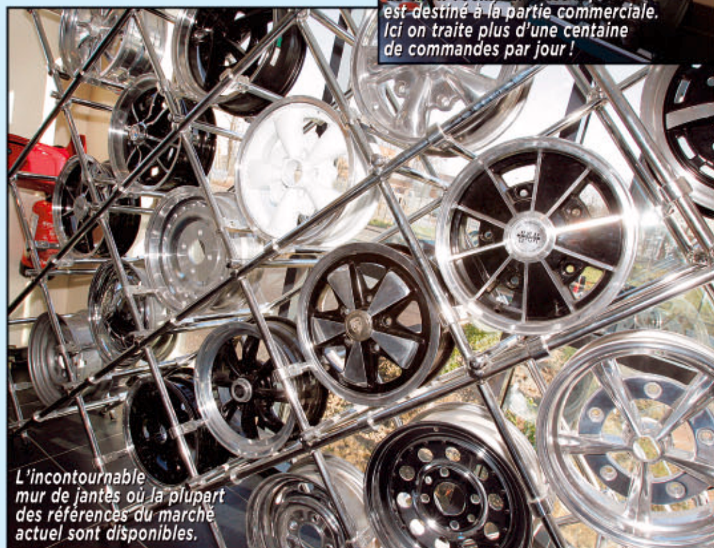
L'incontournable mur de jantes où la plupart des références du marché actuel sont disponibles.

Mecatechnic. C'est à Bonville, près de Chartres (28) que l'atelier et le magasin sont dans un premier temps implantés. Mais au début, l'activité liée aux rallyes occupe une place importante. Mecatechnic réalise même quelques préparations pour Lada Niva ! En marge, une Cox Baja Class1 (façon "grass hooper") est réalisée, propulsée par un moteur Renault de 2,2 L passé pour le coup en 2,7 L. De quoi se faire remarquer. Et ça tombe bien puisque, au fil des compétitions, comme la Baja espagnole, Mecatechnic se creuse une place bien méritée. Mieux que cela, elle étend ses compétences au secteur de l'aviation, et notamment des ULM qui uti-