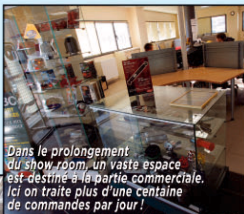
Dans le prolongement du show room, un vaste espace est destiné à la partie commerciale. Ici on traite plus d'une centaine de commandes par jour !